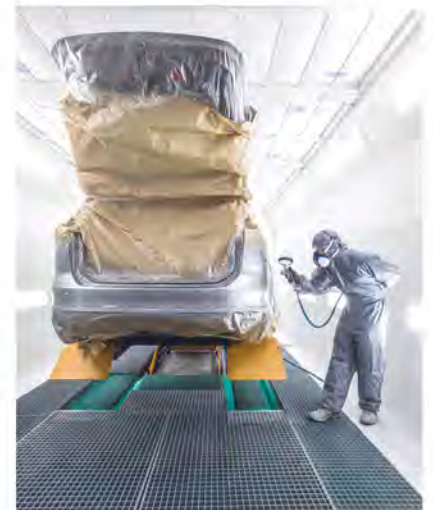
Dimensions de la fosse sur demande.